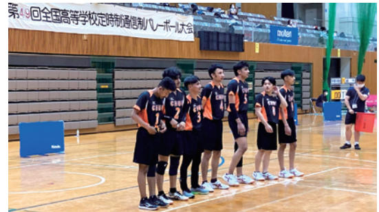
▲ バレーボール全国大会出場

修学旅行(4年)・新入生歓迎会・球技大会・文化部発表会・体育祭・文化祭・映画会・卒業生を送る会