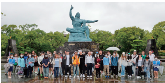
▼ 修学旅行 (長崎、大阪方面)