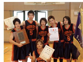
▲バスケットボール部